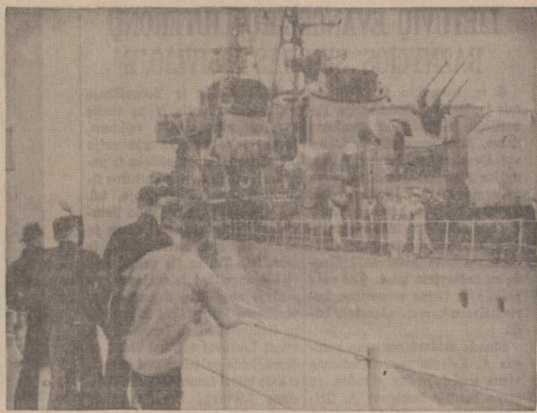
Amerikos jūrininkai sveikino praplaukiančius sovietų jūrininkus, o netrukus sovietų laivas Bessledny geg. 10 dieną stuktelėjo amerikiečių laivui. Atrodo, kad incidentas likviduotas.

nel Naujosios Meksikos vietos. Prie Rhinelander, Wis., pasniogo. Rekordiniai šaltiniai užregistruoti visuose JAV šiaurės rytuose ir šiaurinėse Iugomos Kanados pasieniais.