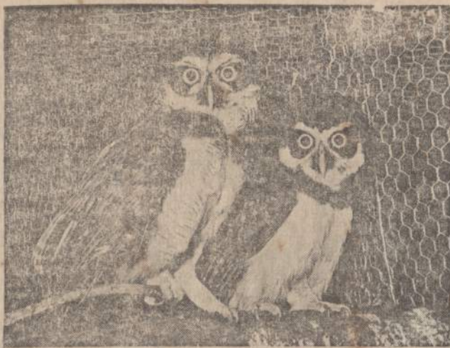
Paveikslė matoma juodakūrinė pelėda gyvena Amerikos žemyne nuo Meksikos iki Argentinos. Ji skiriasi nuo kitų pelėdų tuo, kad josios kojos yra apaugusios plunksnomis. Jos kiaušiniai ne paūgė, bet beveik apskriti, taikūti, kovo mėnesį dedami drėvėse. Pelėdos ir patelės per pasimainymą, o vėliau abu pildėlius mainina. Šių pelėdų klasta nepaprastai gera. Jos, iš vietos nejudėdamos, gali apskuti galva aplinkul ir atidžiai sekti visą apylinkę.