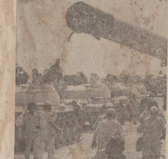
Egipto ir Izraelio pasieniu Naseris sutraukė daug tankų ir artilerijos, matomos šiame paveiksle. Izraelio karo vadovybė taip pat siunčia šarvuotus į pasienį. Izraelio premjeras siūlo Egiptui atšaukti karo jėgas iš pasienio, kad kartais be reikalo nekiltų konfliktas.

reikalinga glaudai visų ginklų rūšių kooperacija, arabų kariuomenė netinkanti. Jei šis karas kiltų, jis ir būtų labai judrus, be pastovių apkasų, prieš naktinio karas. Tokiam karui, stebėtojų manymu, Izraelis esąs geriau pasiruošęs.