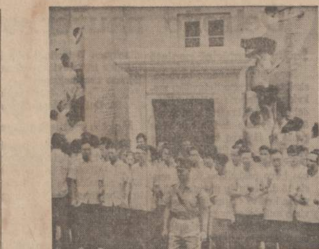
Kinija įsakė Hongkongo komunistams kelti riaušes, bet Hongkongo policija jiems kirtė ir atstotė tvarką. Policija suėmė kelis šimtus triukšmavusių komunistų.

V. V. duoda visą eilę Kariuomenės teismo sprendimų už komunistinę veiklą, palyginamas su baudmėmis streikininkams — ūkininkams. Išvadoje jis rašo: "Komunistų už priešvalstybinių