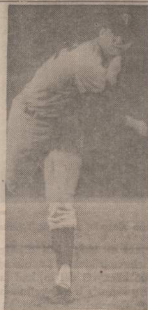
Minnesota Twins žaidėjas Dean Chan- ce moka gerai mesti sviedinį.

BIZNIERIAI, KURIE GARSINASI "NAUJIEŅOSE" — TURI GERIAUSIA PASISEKIMA BIZNYJE — GARSINKIS IR T. U.