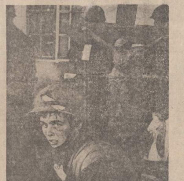
Komunistams pradėjus mirtarais apšaudyti An Hoa marinų bazę Pietų Vietname, vietos bažnyčia buvo paversta ligonine ir apsaugos centru. Paveikslė matome Amerikos marinus bažnytyje.

VATIKANAS. — Popiežius atėmė iš Lenkijos katalikų jurisdikcijos keturias vyskupijas, kurios prieš karą buvo Vokietijos dalimi. Jas administruos Popiežiaus skirti vyskupai, kurie atsakys tiesioginiai Popiežiui.