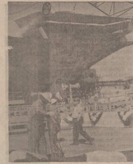
Newport, Va., uoste baigtas dažių lėktuvnešis John F. Kennedy, kad galėtų būti paleistas į vandenyną. Buvusio prezidento dukte Caroline sudavė šampano banką lėktuvnešio krikito metu.

daug sutarčių sulaužusi ir popiergaliais jas pavertusi, kiek tai yra padariusi Sovietų Sąjungai. Faktiškai jai kiekviena sutartis yra tik popiergalis, jei ji nėra jai palanki bei netarnauja jos interesams.