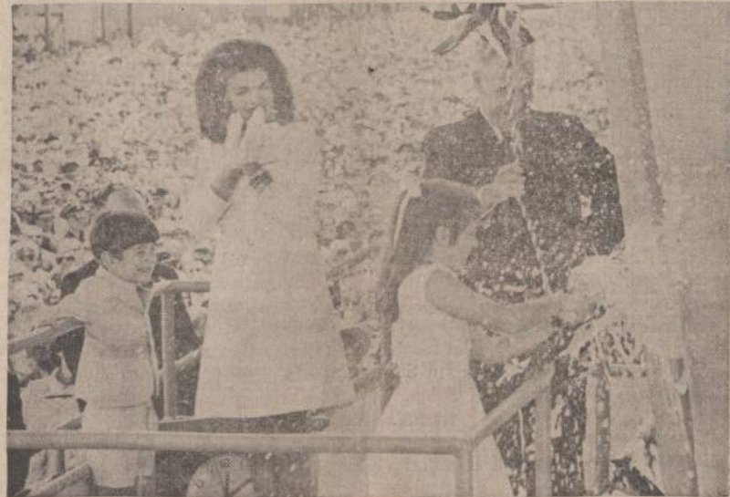
Devynių metų Karolina Kenedaitė, buvusio prezidento duklė, Newport News, Va., uoste pakrikštijo JAV lėktuvnešį josios tėvo vardu. Paveiksle matome Jacqueline Kennedy, krikštijos brolį John Jr. ir visą eilę aukštų pareigūnų.

vos kova ūkinio savarankiškumo 20-me amžiuje... Bet disertacija rengta ir ginama Lietuvos ūkiui esant įjungtam į Rusijos imperijos ūkinę sistemą, Lietuvai neturint nei ūkinio, nei valstybinio savarankiškumo, ir sąlygose, kuriose tokia tema iš viso tėra įmanoma kalbėti tik "einant vienos krypties gatve", tai yra, įrodinėjant tik nesavarankiškumo, tik priklausomybės nuo Maskvos palaimingumą Lietuvai. (E)