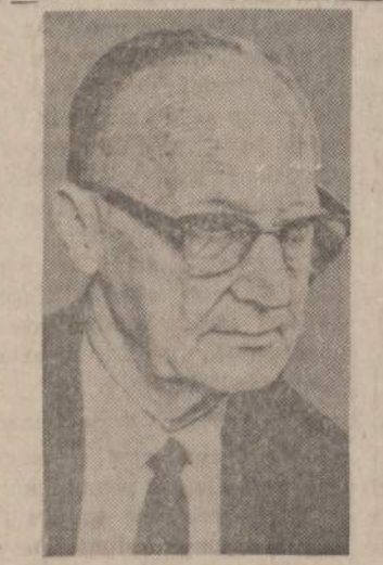
Mokytojas John Scopes labai patenkintas, kad Tennessee seimas panaikino įstatymą, draudžiantį mokyti apie evoliuciją.

Naujausią įvyki aprašė Chicago Sun-Times dienraštis,