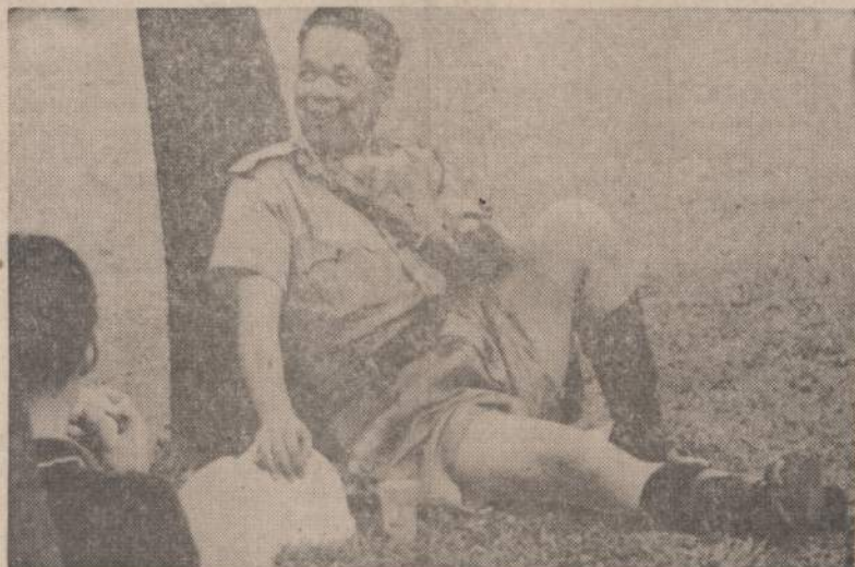
Hongkongo policininkas, gavęs progos atsikvėpti, kalbasi su laikraštiniškai. Policija gavo įsakymą vartoti gumines lazdas, kai komunistų gaujos bandė pasiekti miesto centrą ir veržtis į didžiąsias krautuves. Atrodo, kad policininkas lazdos Hongkongo komunistai bijo. Jie aprimo.

nepripažindami Tautinės Kinijos, apsunkindavo Tarybos posėdžius gegužės mėnesį dėl to, kad tarybai pirmininkavo Tautinės Kinijos atstovas.