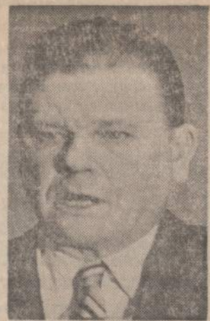
Itakingas respublikonų senatorius tai JAV vyriausybė gali sumažinti at Thurston B. Morton mano, kad tikminio karo pavoju.