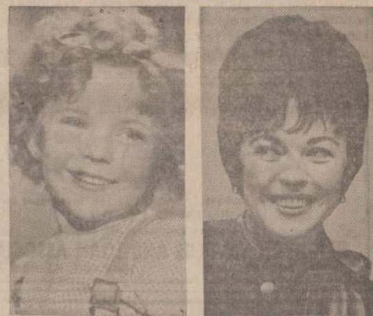
Buvo pasklides gandas, kad Shirley Temple (kairė) dabartinė polia Charles Black (dešinė), bus respublikonų partijos kandidatė į kongresą, bet ji pareiškė, kad ji į politiką neįsivels.