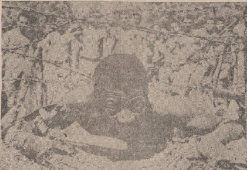
Egipto kariai apmokomi, kaip prasiveržti pro pasienyje pastatytas spygliuotų vielų tvoras.

Jei Jungtinės Tautos nesugebės išspręsti šito karo, jų orumas ir reputacija viso pasaulio akyse smarkiai nuokris.