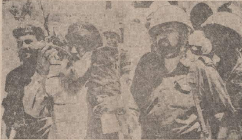
Izraelio kariuomenės vyriausiasis kapelionas, gen. Šlomas Goren, kitų rabinų lydymas, priėjo prie Jeruzalės Raudų Sienos ir užtrimtavo biblinį ragą.