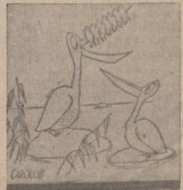
Piknikas prie Meksikos įlankos "Žiūrėk, ma, šašlikas!"