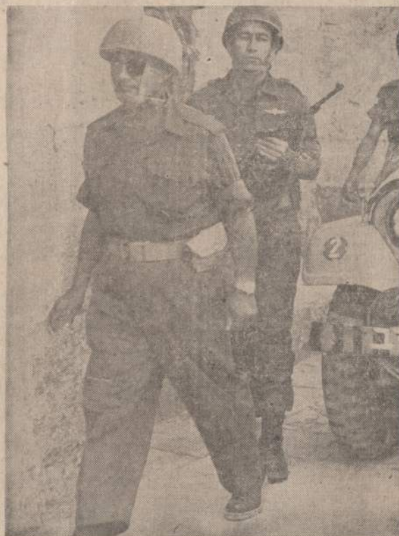
Izraelio krašto apsaugos ministeris Moše Dayan, per šešias dienas sumušęs Naserio armiją ir atėmęs 700 sovietišku tanku, apžūrinėja išlaisvintą Jeruzalę. Izraelis panaikino anksčiau buvusius susitarimus ir nesirengia atiduoti užimtų senų Palestinos žemių.