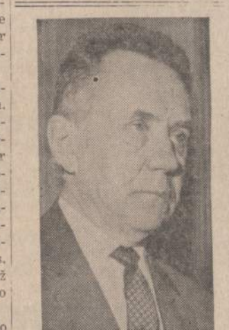
Sovietų premjeras Aleksej Kosyginas važiuoja į specialiai suaukta Jungtinių Tautų sesiją Artimųjų Rytų problemoms spręsti.