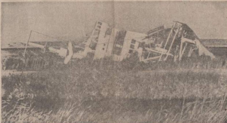
Nuskandinti laivai sustabdė judėjimą Suez'o kanalu. Specialistai tvirtina, kad egiptiečiai užtruko bent šešis mėnesius, kol iškelė dešimt nuskendusiu laivų. Nasseris sako, kad žydai nuskandino laivus pirmomis karo dienomis. Karo veiksmams sustabdyti, bet Izraelis kontroliuoja dešininį Suez'o kanalo krantą. Be žydų sutikimo ir paties Nasserio laivai negalės plaukioti Suez'o kanalu.

Japonijos žibalo rūpesčiai nerūpi japonų laivų statybos bendrovėms, kurios specializuojasi didžiulių tanklaivių statyboje. Tikimasi, kad dabar, uždarius Suez'o kanalą, laivininkystės bendrovės užsaks daugiau milžiniškų tanklaivių.