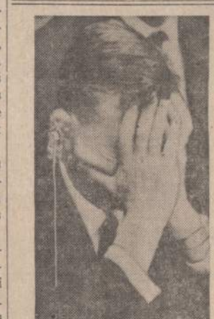
Izraelio atstovas Jungtinėse Tautose klauso sovietų atstovo nepagrįstų kaltinimų.