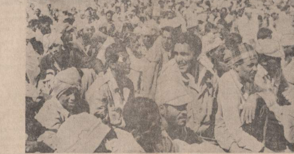
Izraelitai nuginklavo tūkstančius arabų. 5,500 Naserio belaisvių jie paruošė siusti per Suezio kanalą. Paveiksle matome grupę Naserio karių, pasiruošusių plaukti per Suezio kanalą. Sinajaus pusiasalyje buvo apie 100,000 Egipto karių. Visi metė ginklus.