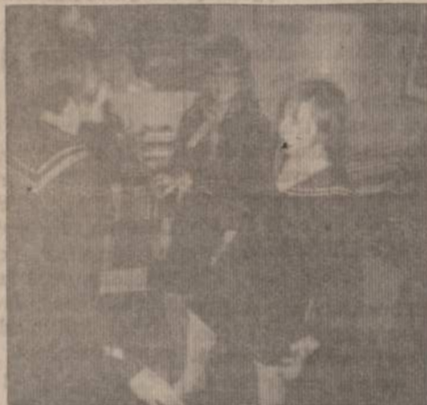
Mokomės šokti. Pasaulio skautų diena, vasario mėn. 22 d. mokomės šokti graikišką šokį, tai momentas iš "Galvės" valtys sueigos, Lemonte.

ku, nes vasaros yra labai karštos ir sausos. Žemė yra labai akmenėta ir vandenį reikia nešti iš labai toli. Nežiūrint to, jos yra nemulstamos stovyklautojos ir dažnai daro ilgas iškylas, kad galėtų aplankyti Graikijos senovės palikimų.