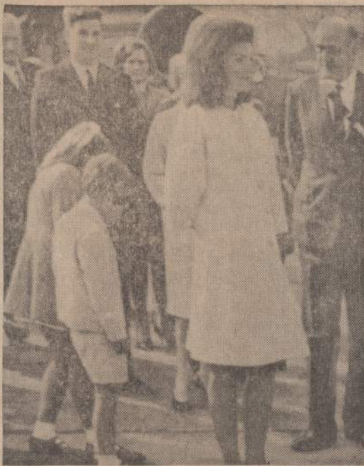
Jacqueline Kennedy su abiem vaikais atskrido į Irlandiją. Paveiksle ją mato me Shannon aerodrome. Susirinkusiems ji pasakė trumpą kalbą. Airliai labai šiltai ją priėmė.