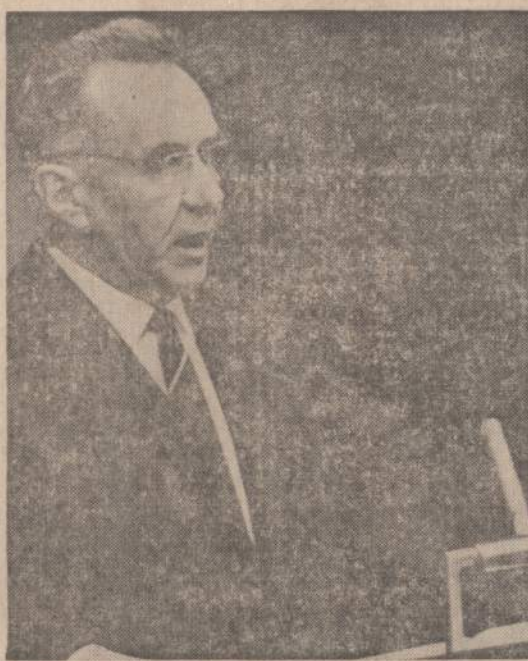
Sovietų premjeras Aleksej Kosygin kalba Jungtinėse Tautose. Jis prašo Jungtines Tautas paskelbti Izraelį užpuoliku, atšaukti savo kariuomenę iš buvusios Izraelio teritorijų ir sugražinti arabams visus atimtus ginklus. Žydai nieko nedarys, kol nesužais su arabais taikos klausimais.

Izraelis reikalauja teisės naudotis ne tik Akabos įlanka, bet ir Suez'o kanalu.