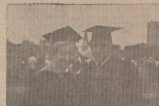
Duktė — dantų gydytoja; sūnus — biologijos bakalauras