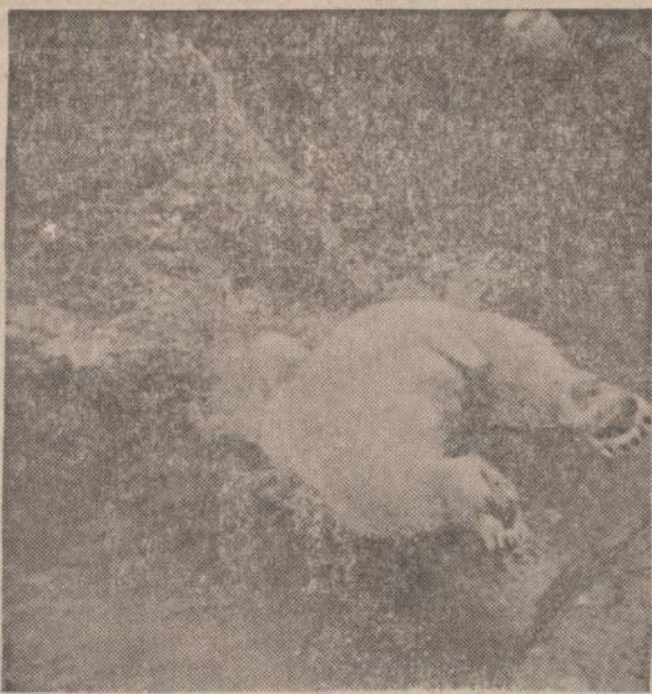
Visą Ameriką užgulė karšto oro banga. Washingtono, D. C., zoologiniame parke esančios šiaurės meškos labai noriai maudosi šaltame vandenyje.