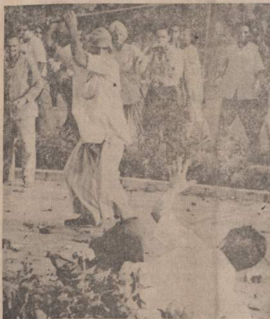
Kinijos komunistų sukurstyti vaikėzai Pekine sumušė Indijos diplomatinės tarnybos atstovus. New Delhi mieste indas tuo pačiu atsimoka komunistinės Kinijos diplomatu. Komunistas jau parkrito, bet indas užsimojęs dar vieną jam tvoti.

Arabams nepatinka ir tai, kad Kosyginas neminėjo savo kalboje Akabos įlankos. Manoma, kad sovietai rems Izraelio teises naudotis tos įlankos vandenimis.