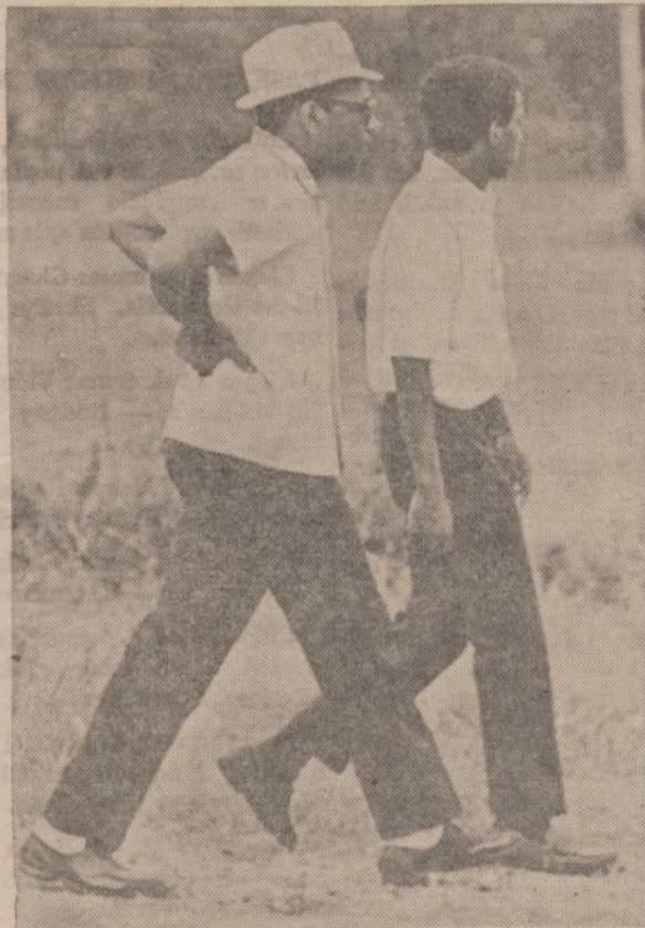
Jackson universitetą baigusiam negrui skauda kojas, bet jis tęsia savo žingsniuotę. Jis nori parodyti, kad Mississippi keliais negrai gali vaikščioti.