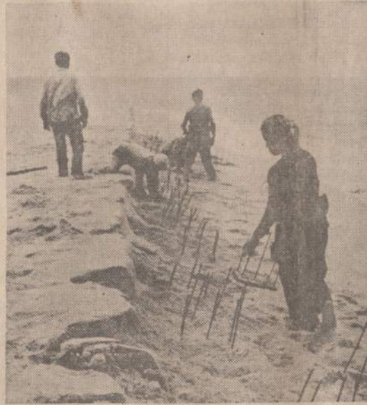
Hanojaus valdžia verčia šiaurės Vietnamo gyventojus minuoti pakraščius. Paveikslė matome Dong Hoi kaimo žmones, dedančius minas

Laimėjo rinkimus MEKSIKA. — Valdancioji in-stitucinė revoliucionierių parti-ja Meksikoje laimėjo beveik vi-sas 178 parlamento vietas. Dar neaiškūs kelių rajonų rezulta-tai. Iš septynių provincijų gu-bernatorių partių, visas laimėjo valdancioji partija. Praėjusiam parlamente val-džia pati davė opozicijos parti-joms vietas. Tautinės akcijos partija gavo 13 vietų, marksistų liaudies partija — 9 vietas ir tikrųjų marksistų — 5 vietas. Šių partijų turėtos vietos padė-tas: Lietuvių tebesiaučias oku-panto brutalumas. (E)