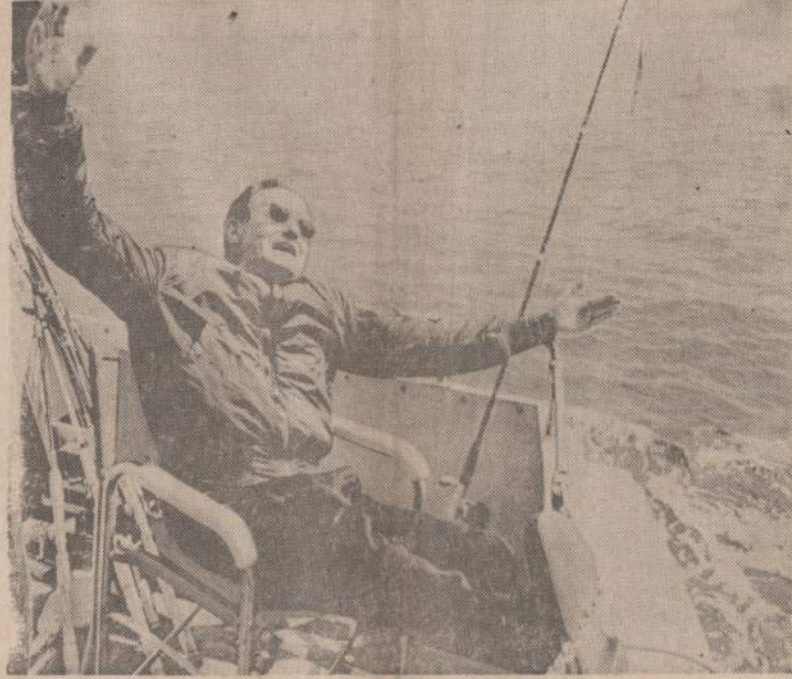
Viceprezidentas Humphrey meškerioja Aliaskos vandenynė. Savo draugams jis aiškina, kokio dydžio žuvi jam pavyko ištraukti.

Egiptui bus suduotas mirtinas smūgis, nes jis neteks didesnę dalies Suez kanalo pajamų.