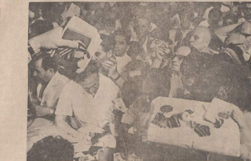
Antrojo Pasaulinio karo veteranai Telavive gražina medalius, gautus iš komunistų kraštų. Jie protestuoja prieš Sovietų Rusijos ir kitų komunistinių kraštų padarytus kaltinimus Izraeliui.

Jungtinėse Tautose Kongo atstovas kaltino belgų, prancūzų ir ispanų pagelbą Kongo sukilėliams. Prisiėdęsi ir Portugalija, kuri iš savo Angolos kolonijos padedanti Kongo maištininkams. Kongo bus panaikinti visi samdytų baltųjų kariuomenės daliniai.