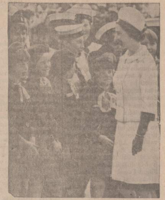
Anglijos karalienė Elzbieta, atvažiavusi į Kanada, sveikina Kingstono skautų grupę. Anglijos karalienė mėgsta skautus, nes ji pati skautavo.

Ir tą absoliutišką pavergimą mes labai apgailestaujame. Mums labai skauda matyti, kaip lietuvis pavergtas, koku beteisū jis padarytas.