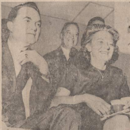
Lurleen Wallace nuvažiavo į Houston ligoninę vežio operacijai. Josios vyras, buvęs Alabamos gubernatorius, nuvedė savo žmoną, dabartinę Alabamos gubernatorę, pasidėvėti, kaip Houston beisbolicininkai žaidžia.

Pietų Vietnamo gynybos sekretorius McNamara iš helikopterio apie 20 minučių stebėjo karo veiksmus prie demilitarizuotos zonos. Čia šiais metais vyko sunkiausi mūšiai, kurie dar nėra pasibaigę. Amerikos mariniai čia turėjo sunkių nuostolių, nes komunistai apšaudė jų pozicijas iš demilitarizuotoje zonoje paslėptų baterijų ir vis atsiūcė naujų jėgų iš šiaurės. McNamara turi šiomis dienomis grįžti atgal į Washingtoną. Jis nu-