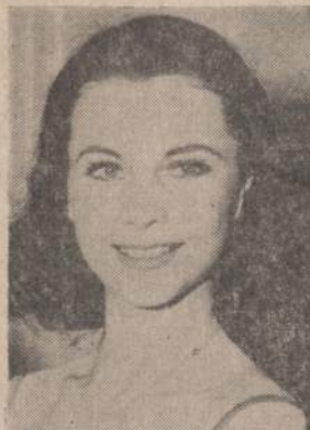
Britų artistė Vivien Leigh, sulaukusi 53 metų amžiaus, nuo džiuvos mirė Londone.

TOKIJO. — Japonijoje uraganas Billie sukėlė potvynius. Žuvo 350 asmenų.