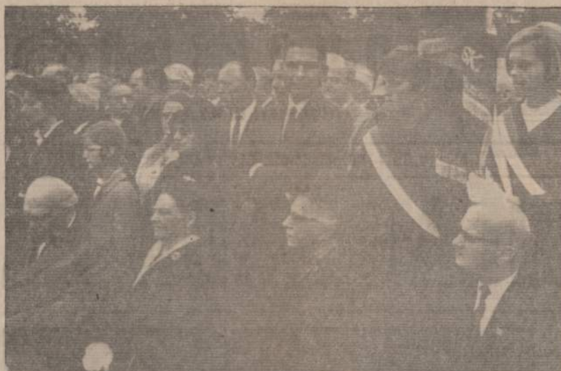
DR. KAZIO GRINIAUS PAMINKLO ATIDENGIMO IŠKILMESE

Stovykloje dalyvauti visų pirma kviečiami ir tam tikra prasme įpareigoti tie, kurie už panašias pareigas atsakingi metų bėgyje, tai yra, Brolijos vadijos nariai, Rajonų lavinimo skyrių