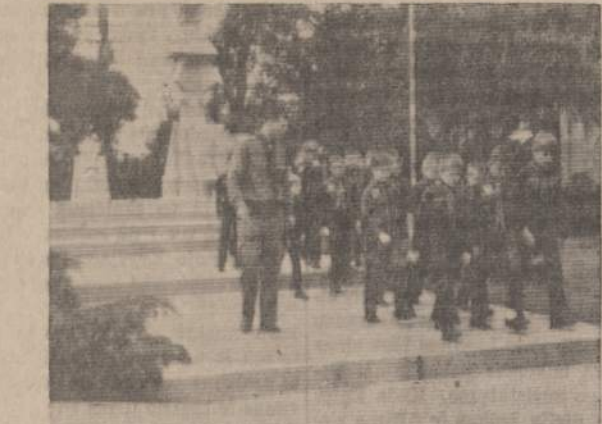
"VIENS, DU, TRYS..."

Šarūnietis R. Vedegys žygiuoja su savo "vilku" draugove Chicagoje.