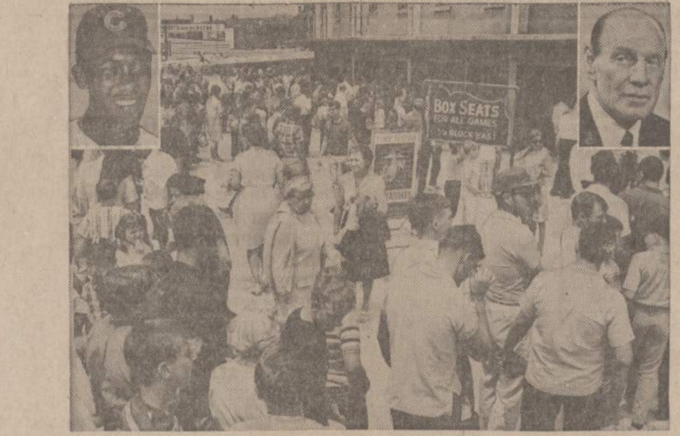
Perorganizavus Chicago sportininkus, žmonės ir vėl eina į Wrigley Field, kad galėtų pamatyti žaidžiančius Cubs.