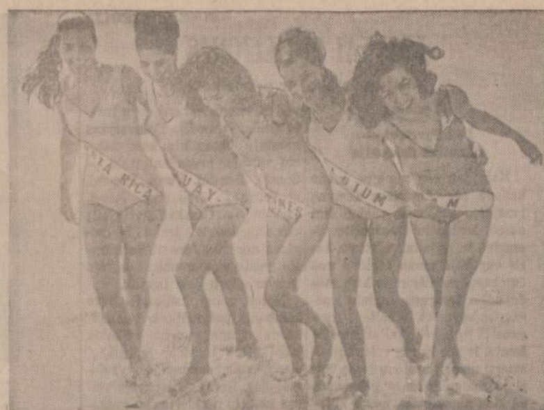
Liepos 15 dienos vakarą Miami Beach saloje bus renkama 1967 m. Pasaulio gražiausioji moteris. Paveiksle matome penkias gražuoles, atvažiuojusias į gražiausios moters kontestą.

● Radikalus yra žmogus, kuris stovi kojomis atsiremęs į orą. Franklin D. Roosevelt