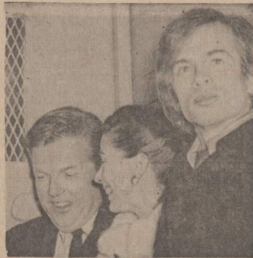
Britų karališko baleto šokėja Margot Fonteyn, o dešinėje baleto šokėjas Rudolf Nureyev vežami į San Francisco policiją. Jie buvo suminti viename kabarete.

Kai savo didžiųjų ir mažesnių kunigaikščių nė vieno vardo neužtikau, tai emiau ieškoti bene užtiksiu kurio nors lietuviško muziko vardą. Ir tų neradau ir negalėjau rasti, nes visi mūsų