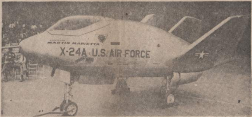
Baltimorėje parodytas besparnis lėktuvas X-24, kurio pareiga bus erdvėje paklydusius astronautus pagauti ir parnešti žemėn. Paveiksle matomas projektas kainavo apie pusantro milijono dolerių.

sovinių. Negrai tvirtina, kad artistas Jones vadovauja Newarko "black power" judėjimui.