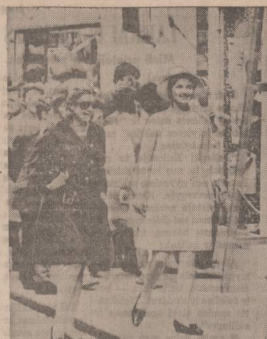
Prezidento dukterė Linda B. Johnson Londonan nuvažiavo kelius dešimtmečius sionėliu, bet ten negalėjo atsisipirti naujaisiomis madom. Ambasadoriaus Bruce žinoma prezidento dukrą nuvedė į pačią moderniausią krautuvę ir parinko paveikslė matomą sionę. Linda ir ponis D. Bruce eina Londono gatve.

J. V. Stašinas ir V. Molotovas išsuderėjo iš nacinės Vokietijos "įtaką" į Suomiją, Estiją, Latviją, rytinius plotus Lenkijos, Besarabiją ir kitas žemes, susirūpino, kad akmenotas ir smėlėtas pietinės Lietuvos ruoželis nepatektų Vokietijos globon. Sovietų Sąjungos didieji naktiniai pradėjo nemiegoti, bekalkuliuodami, kaip iš Adolfo Hitlerio atgauti jam pažadėtą, menamą sienų išsieninimo sumetimais, svetimos valstybės - Lietuvos teritorijos dalį. Rūpinotieji grobikai pradėjo negirdėtas derybas Lietuvos žemės reikalu. Šios derybos privalo gabiausių literatų plunksnos ar iškilųjų publicistų bei mokslininkų veikalų, ypač šiais laikais, kada vienas ty grobių - Sovietų Sąjunga kaltina visus kitus imperializmu, neva už-