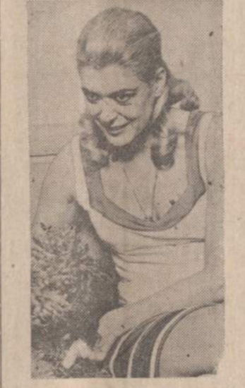
Graikų artistė Melina Mercouri per užsienio radiją sako kalbas, ragindama graikus kovoti prieš fašistinius generolus. Graikų valdžia prasi į nutilti bent vasaros mėnesiais, kad nesibaidytų turistai. Artistė atsisakius, generolai nutarė atimti jai Graikijos pilietybę.

Dabartinio baltųjų kareivių sukilimo metu ne vienas belgas nukentėjo nuo įpykusio kongiečių minios. Belgijon jau sugrįžo keli lėktuvai pabėgusių iš Kongo žmonių. Jų pasakojimai apie žiaurumus ir smurtą sukėlė Belgijoje pasipiktinimo bangą.