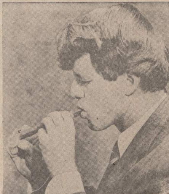
Sen. Robert F. Kennedy dega cigarą ir rengiasi klausyti liudijimų, kaip Mississippi valstijoje vietomis gyventojų vaikai badauja.

Viena plieno išdirbimo įmonė, didžiulė nauja Jones & McLaughlin Steel Corp. savo pramonės atmatas mylios gilumo suliniais leis į žemės gelmių klodus apie mylios gilumo, kur jos susigers ir porotų volų klodus. Pasirodo, jau apie 50 metų kai kurios firmos tokį metodą praktikuojančios. Tik vėl keliamą baimę, kad tokie atmatų nuleidimai į žemės gelmes sugadina požeminį vandenį, kurį inžinieriai nori sunaudoti žmonių vartojimui ateityje, kai tik bus išrastas būdas, kaip iš vandens ištraukti druską. Tokio sūrio vandens dideli ištekliai esą mylios-divejų gelmėje Illinoisuje ir tas vanduo esąs labai sūrus. Jei pramonė pradės leisti savo atmatų skysčius į žemės gelmes, esą pavojaus, kad gali užteršti tuos požeminio vandens baseinus, kurie pačios gamtos yra laikomi atsargoje... Bethlehem ir U. S. Steel taip pat žada leisti savo produkcijos atmatas skysčius į žemės gelmes.