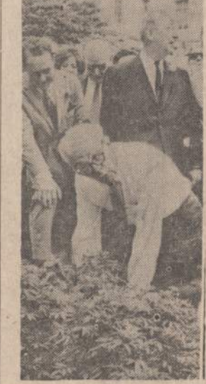
Illinois senatorius Everett Dirksen nusivilko švarką ir sodina gėles įstatymų leidimo įstaigos įsivėse.