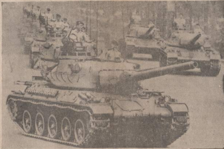
Eliziejus aikšte važiuoja patys naujausieji prancūzų 34 tonų tankai. Prancūzai tvirtina, kad šių tankų kanuolės gali perkirsti bet kurio esamų tankų šarvus. Charles de Gaulle įsivaizduoja, kad prancūzų šarvuočiai nepaimami.

Tai antras toks užpuolimas ant Laoso aviacijos. Pirmą kartą bombonešiai bandyta sunaikinti šių metų vasario mėnesį. Lėktuvus užpuolė Pathet Lao partizanai, klausantieji komunistų įsakymų. (E)