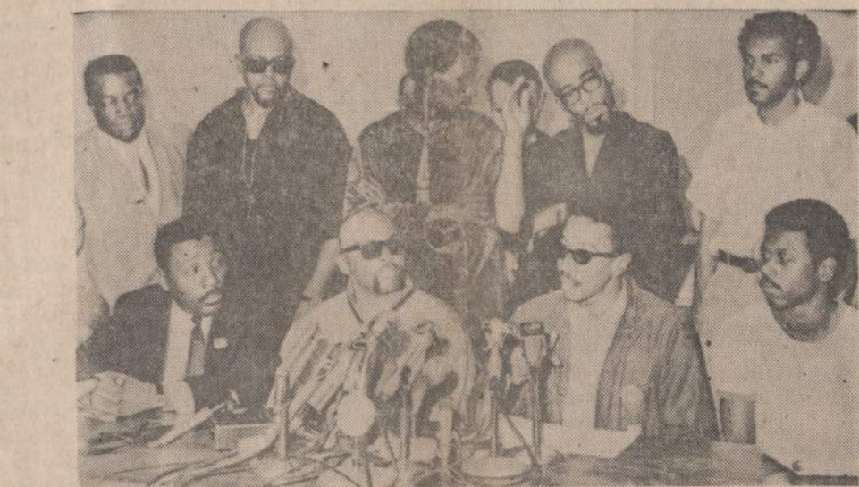
Newarke, N. J., šiomis dienomis posėdžiavo "juodosios jėgos" vadai. Suvažiavusių tarpe yra ir komedijantas Dick Gregory, sėdintis kairėje. Kiti nėra artistai, bet kiekvienas yra labai griežtas ir karštas kalbėtojas.

WASHINGTON. — Istorikas Arthur M. Schlesinger, buvęs prezidento Kennedžio padėjėjas, kreipėsi į Harper & Row knygų leidyklą, kad sulaukytų vienam mėnesiui išleidimą Svetlanos Aleuevos (Stalino dukters) atsiminimų knygos. Numatyta knygą išleisti spalio 16 d. O prieš tai numatyta New York Times laikraštyje ir Life žurnale spausdinti ištraukas iš tos knygos. Schlesingeris teigia, jog tai pakenktų geriems Amerikos santykiams su Sovietų Sąjunga, kuri spalio mėnesį minės bolševikinės revoliucijos 50 metų sukaktį. Kad to būtų galima išvengti, esą, reikalinga Svetlanos atsiminimų spausdinimą (ypač knygų išleidimą) atidėti, kol praeis revoliucijos sukakties minėjimas.