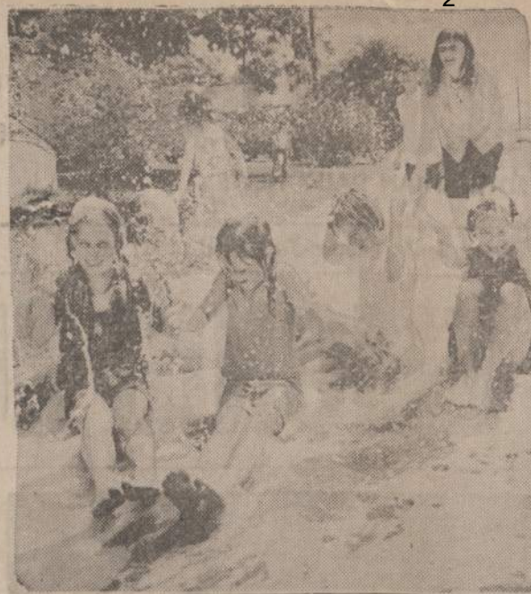
Duarte, Cal., miestelyje sprogo vieno muilo fabriko vamzdis. Ugnia-giesiai palietė skystį plovę į upelį. Tuo tarpu mergaitėms buvo burbulų ir proga pabužinti be čiuztuvu.

Bene daugiausia okupantams nemalonumo padarė, tai buvusi birželio 23 d. lietuvių diena. Apie tai Vieniubėje, tarp kitko, taip rašoma: "Atsijaveikinant, salės gale pasigirdo "Lietuva Tėvynė mūsų". Didelė publikos dalis sustojo, pakilo iš vietų ir Lietuvos delegacijos nariai ir išėjo iš salės. Tuo tarpu salės gale tebeaidėjo himnas, kurio garsus nustelbė garsiakalbiai su lietu-