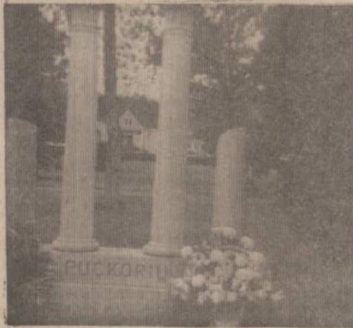
Pučkorių paminklas Lietuvių Tautinėse Kapinėse