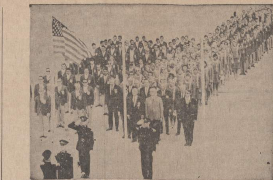
Winnipeg, Can., vyksta visos Amerikos žaidimai. Paveiksle matome JAV sportininkus, stovinčius prie vėliavos. Greta stovi Venecuelos sportininkai.

Amerikiečiai paskelbė, kad gyventojai atiduotų turimus ginklus. Aš dar turėjau paslėptą medžioklinį šautuvą, tai ir tą nu-