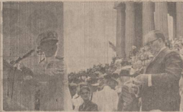
Soldiers Fieldo aikštėje Chicagos meras Richard Daley ir laivyno komandierius kalba į susirinkusius jūrininkus ir gausius šikagiečius.

Palyginti dar neseniai (Pirmojo Pasaulinio karo pabaigoje) gydymas badavimu-pasninkavimu Vokietijoje buvo drausti-