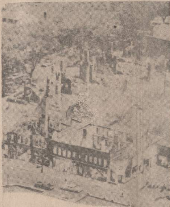
Negrų išdegtas Detroito kvartalas. Gaisro pradžioje ugniagesiai bandė gesinti, bet jie buvo apšaudyti. Policija negalėjo apginti ugniagesių nuo užpuolikų.

Kinų raudonarmiečiai japonams užpakalin palaužė rankas, vedžiojo juos koridoriais aplinkui viešbutį ir paskui jiems surėngė "teismą".