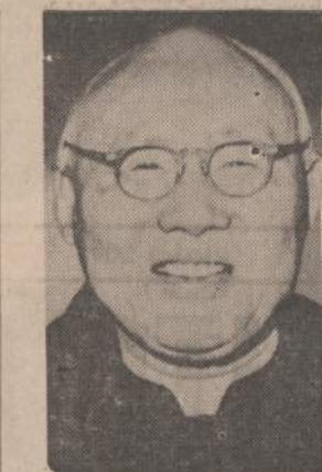
Kinijos kardinolas Thomas Tien, sulaukęs 77 metų amžiaus, mirė nuo plaučių uždegimo. Tai buvo vienintelis kardinolas kinietis.

Iš žaliuojančios pievos įžengęs į mišką aš matau kaip čia vėsliai auga senovės Lietuvoje buvę šventi medžiai — milžiniško aukštumo ir storio ąžuolai, ša-