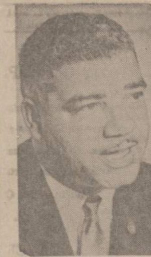
Kongreso komitetui Whitney Young pareiškė, kad Newarko miesto vadovybė kalta dėl sukeltų riaušių. Miesto vadovybė praše, kad federalinė valdžia Newarkui, kaip pavyz. tvarkomam miestui, skirtų pinigų. Newark žinojo, kad Newarkas nebuvo pavyzdingai tvarkomas, todėl ir pradėjo maištauti.

Chicagoje rugsėjo 21, 22 ir 23 dienomis įvyksčiausiai respublikonų moterų konferencijai pakviestas kalbėti vienintelis negras senatorius Edward R. Brooke (respublikonas iš Massachusetts). Brooke yra vienas iš prezidento paskirtos rasiuėms riaušėms tirti komisijos narių. Pravedus respublikonų moterų tarpe atsiklausimą, rasta, kad už Brooke pasisakė didžioji dauguma. Kitas kalbėtojas bus senatorius Thurstion Morton (R. Ky.).