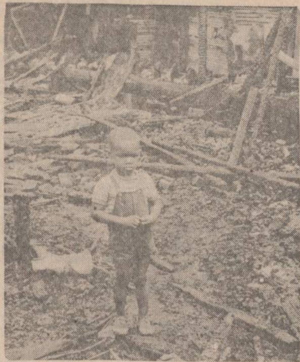
Detroito negriukas stovi šalia sudeginto namo. "Juodosios jėgos" salininkai Detroito pirmiausia pradėjo deginti negrų apgyventus namus.