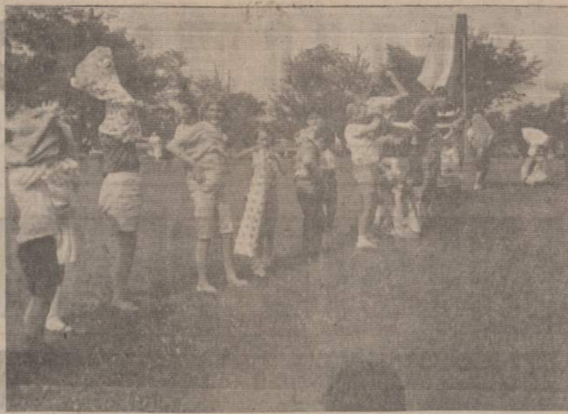
Alvudo globojami Naujienu išvažiavime vaikučiai naudingai užsima — lenda pro maišus.

ATSAKYMAS: Ne narkotinis vaistas yra kaltas narkomanijoj, bet žmogus, kuris jį vartoja. Įprato kultūringas žmogus rūkyti — juk tai iš laukinių pasiimtas protis. Jau dabar planuojama nebausti narkotikų vartojančius: pataikaujama silpnasviamis. O jie vis naujus kelius savo menkadvasiškimui rodyti susiranom: dar pavojingesnis už LSD vaistas dabar plačiai imtas vartoti Kalifornijoj — tai taip vadinamas STP. Paprastoj kalboj tas natūras narkotinis vaistas vadinamas "caviar of psychodelics." Jau mažiau lauzinas to vaisto vartotojų atsigulė San Francisco ir Ontario, Kalifornijos ligoninėse.