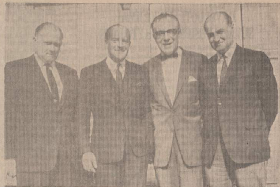
Vilko pirmininkas su Clevelando demokratinų grupių atstovais

Toliau einantis pagrindinis kelias vėl prapuola medžių tankumyne ir nors akimis išė-