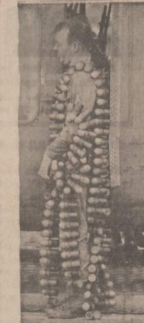
Pietų Vietname esančios 334 helikopterų kuopos šaulys, pasirūpinęs nemažai amunicijos, ruošiasi lipiti į savo helikopterį.

„Apgaistaudami, kad pataikūnai ir kiti silpnos valios lietuviai veda derybas su Maskvos agentais nuo prieštaraujami Lietuvių Tautos siekimams ir paniekindami tūkstančių partizanų gyvybių au-