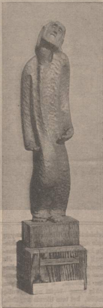
Dagys Skulptūra (Čiurlionio galerijos Chicagoje nuosavybė)

Mudviem toliau besinant ir besirušiant eiti namo, staiga pradėjo lyti. Ir ta proga kitas mudviejų pažįstamas, evange-