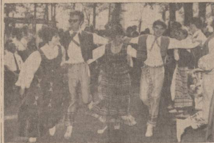
W. L. D. Tautiniai šokiai Kenoshoje.