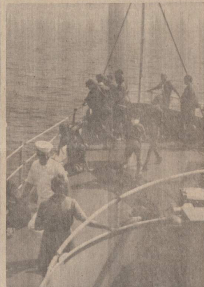
Detrito skautai stovyklos metu karišku laivu plaukioja Michigano ežere. Laivo kariai pagerbė skautus paleisdami keletą išvųjų iš patrankų.

Visi lietuviai maloniai kviečiami į "N." pikniką