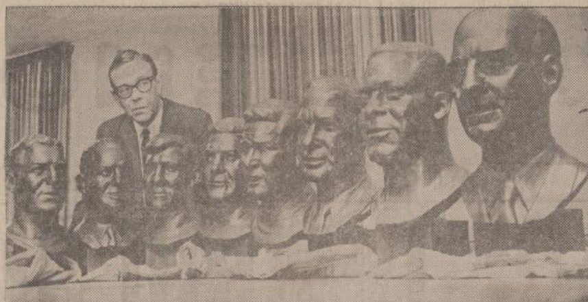
Paveiksle matom gerų sportininkų biustus, kurie bus pastatyti garbės salėje.

1. Žmogus elgiasi taip, kaip jis nustiekia. Visi stenkimės nusiteikti mediciniškų žinių pildymui, nors jos mums visai svetimos lūty. 2. Geras kietų vidurių tvarkymas turi sustiprinti paciento sveikatą, o nesustiprinti jį. 3. Bet kokių stipresniū liuosuojančių vaistų niekada nevertoti, išskyrus minėtus retus atvejus, kai žmogus rengiamas operacijai ar tyrimams. 4. Venkime dažnų klizmų. 5. Reikia žmogaus nusiteikimus sureguliuoti: jis turi suprasti esmę kietų vidurių tvarkymo. Jei jis neturi organiško vidurių pakenkimo (guzo, susiaurėjimo ir pan.), tai turi žinoti, kad be liuosuojančių vaistų, o naudojant reikiamą maistą ir pakankamą skysčių, su lengvais priedais,