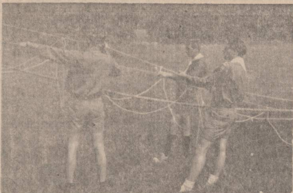
Žalgirio stovyklos skautai stato tiltą dr. Valantiejiaus ūkyje prie New Buffalo.