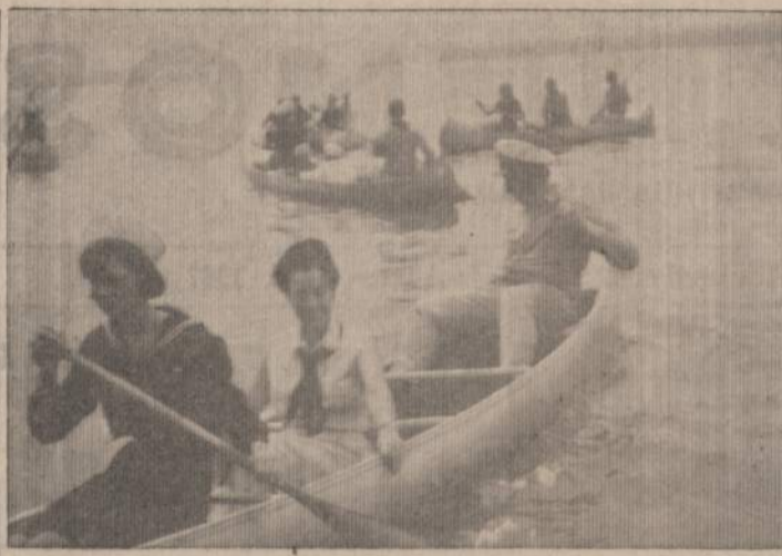
Saulė, vanduo ir laivelis — skauto svajonė, jo džiaugsmas... Chicagos L. J. skautai užsiėmimų metu.