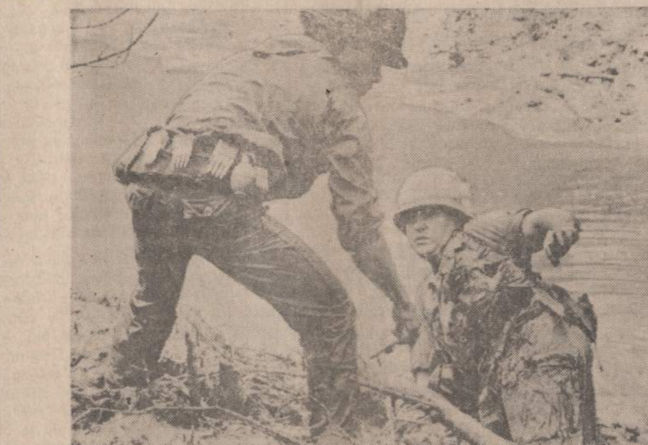
Netoli Saigono vietnamietis karys traukia iš klampynės JAV kari, tikrinusį upės pakraščius ir gerokai įklampus.

♦ Saigone policija suėmė teroristą, kuris prieš du metus sušprogdino plaukiojantį restoraną, kur žuvo 30 asmenų.