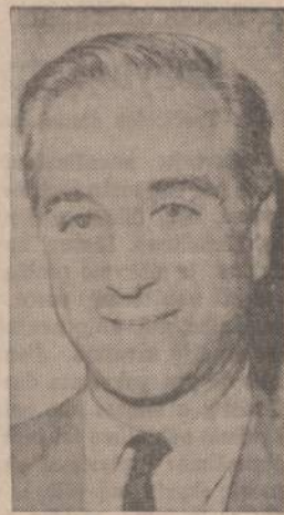
Milijonierius Howard J. Samuels bus paskirtas prekybos departamento sekretoriaus pavaduotoju. 1966 m. jis norėjo tapti New Yorko gubernatoriaus pavaduotoju, bet pralaimėjo rinkimus. Dabar prezidentas Johnsonas jį skiria aukštomis ir atsakomoms pareigoms.

Bet nekitaip su kaimomis yra ir kitose srityse. Toks, daug sakantis kad ir mažas pavyzdė-