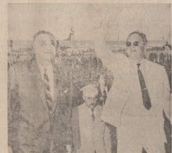
Egipto prezidentas Naseris pasitiko į Kairą atskridusį Jugoslavijos prezidentą Tito, kuris siūlys Egiptui taikytis su Izraeliu.