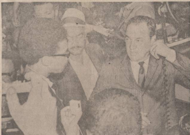
Floridos gubernatorius Claude Kirk vienas atvyko į negru susirinkimą, paėmė mikrofoną iš pramūstgalvio Rap Brown, ir viešai įspėjo jį nekaltėti apie revolverius Floridoje.