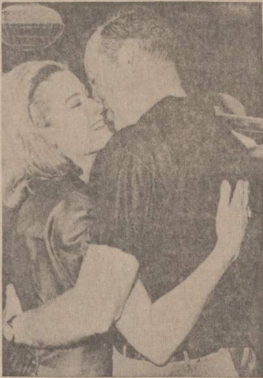
Amerikon atvažiuvi Monako kunigaikštienė Grace nuodirdžiai sveikinasi su Delbert Mann, buvusiu jos filmų direktorium.

Apylinkių gamta neturtinga: nuogi kalnai su nusususiais augalais. Tuo tarpu mus vežantis