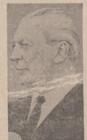
Vakary Vokietijos premjeras Kurt Kiesinger atvyko 6 dienoms į JAV, kad galėtų išsikabinti su prezidentu Johnsonu įvairiais užsienio politikos reikalais.

Prezidentas Johnsonas, sutikdamas kanclerį Kiesingerį, pareiškė, kad Amerika yra pasirodusi ginti Vakary Vokietiją. Amerika dėsianti pastangas suvienyti atskirtas Vokietijos dalis.