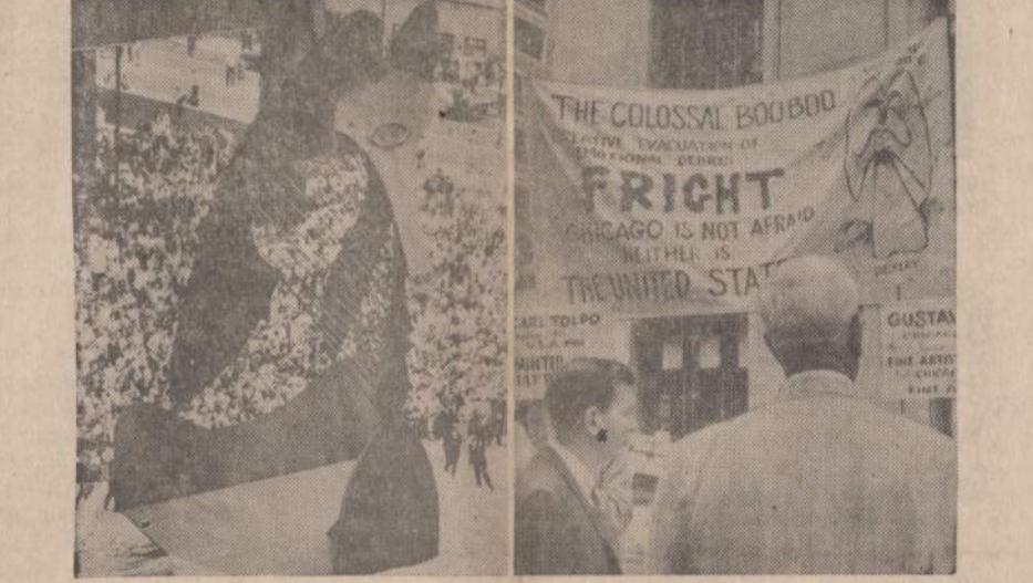
Chicagoje prie Civic Center namo buvo atidarytas Picasso paminklas (kairė). Dešinėje plakatas sako, jog tai yra didelis nesupratimas.

Savo laiške tėvai sako, kad jau laikas prezidentui nuimti pančius nuo Amerikos karinės vadovybės rankų ir leisti jai priešą sumušti.