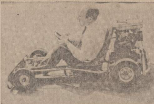
Sterling Moss, buvęs britų automobilių lenktynių dalyvis, Ottawoje važinėja savo mašina, bėmokydamas vaikus saugiai važinėti gatvėmis.