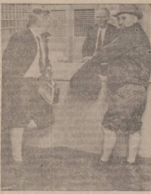
Teko evakuoti visu šėliu aukštą Fairbanks, Alaska, hotelio gyventojus, kai pirmąjį aukštą pradėjo veržtis pakilusios Chen upės vanduo.