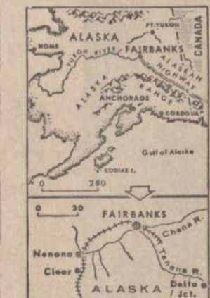
Fairbanks miestas apsemtas vandeniū. Nuo didelio lietaus užtvėnus upėmis, teko evakuoti visus Fairbanks gyventojus. Miestui bus teikiama federalinės valdžios parama.

Pareiškime minima ir Europos kraštų vienybė bei bendradarbiavimas. Tokia vieninga Europa bus Amerikos draugas ir partneris.