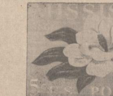
Mississippi valstijos šimto metų sukakties proga išleistas JAV 5 centų paštas ženklas, vaizduojas labai plačiai toje valstijoje augančią gėlę.