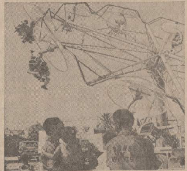
Prieš porą metų Los Angeles priemiestyje Watts vyko kruvinos riaušės, o dabar jaunimas sukineiasi po padanges.