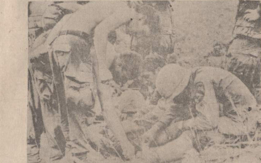
Amerikos kariai, bebraudydami po Vietnamo vandenį, prisirenka įvairių dielių. Išlipę į krantą, degančiomis cigaretėmis lengviausiai jie dielių atsikrato. Paveikslė matome dielių svilvinimo procesą.

Nigerijos gauti lėktuvai gali nulemti civilinį karą. Biafra, turėdama tik vieną bombonešį, sėkmingai jį panaudoja priešui išgašdinti ir išvaikyti. Kareiviai, lėktuvo puolami, dažnai meta ginklus ir bėga į džungles.