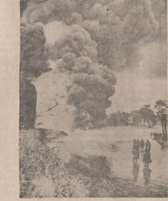
Montrealio Calex Oil bendrovėje kilo didelis gaisras, kurį aštuonias valandas gesino 200 ugniagesių. Daug jų apdego nuo labai karštos ugnies, kuri ne kartą privertė ugniagesius pasitraukti nuo vandens žarnų.

Pekino spauda užvakar rašė apie Hong Kongą ir jo ateitį. Miestas yra amžiasis buvęs Kinijos dalimi ir turi būti vėl sujungtas su Kinija, — rašė "Jenmin Jih Pao". Britai anksčiau ar vėliau turės užmokėti Kinijai turimą kraujo skolą.