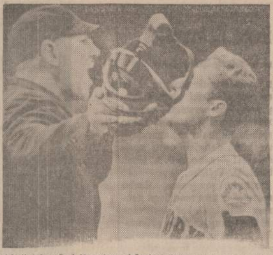
Beisbolininkas Bud Harrelson dažnai ginčydavosi su teisėju Frank Secory. Jam uždėdami varžtai, kad jis išmokyti tylėti. Zaidėjai su teisėjais nesiginčija.