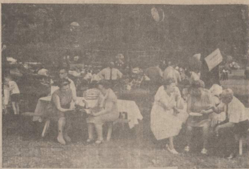
Alvudas praėjusiam "Naujienų" pikenke.

Klausimas. Kas man daryti? Visą skauda, o tuzinas daktarų nepagalbsti. Viduriai kieti. Tik su kas savaitę keičiamais laxativais tuštinuos šiaip taip. Naktį iki keturių ryto neužmiegu — už tai 15 cigarečių surūkiau ir anacino tuziną tablečių per parą sunaudoju. Valgau du kart dienoje. Varškės ir sūrio nė iš tolo nenoriu. Gydytojai gydo nuo pakelto kraujospūdžio, bet nieko nepadaeda. Viena gyvenu, nedirbu, valdžios nedarbingumo pen-