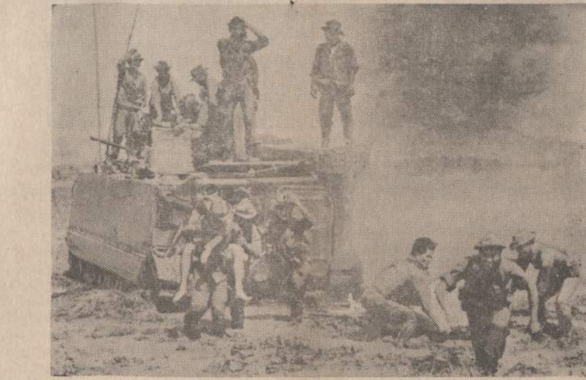
Pietų Vietnamo kareiviai šarvuotą sunkvežimį įstūmė į ryžių laukus ir negali ištraukti. Šarvuotį jie pavertė lauko ligonine. Kai purvas išdžiū, tai bandys jį išvilkti.

Siena, kuri skyrė abi Jeruzalės dalis jau nuversta. Daug namų, kurie stovėjo "niekieno žemėje" jau sulyginti su žeme. Tiesiamos naujos gatvės ir sodinami medžiai. Izraelis yra pasiryžęs padaryti Jeruzalę vienu miestu — žydų rankose.