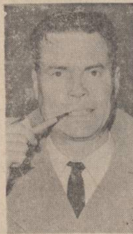
Amerikos nacių partijos vadą George Lincoln Rockwellį praėita penktadienį iš pasalų buvo nušautas Arlington, Va., miestyje. Policija suėmė tos pačios partijos aukštą pareigūną, kuris prisipažino nušovęs 49 metų amžiaus agitatorių ir nacių partijos organizatorių Amerikoje.

Rugpiūčio 10 d. Tiesa rašė: "Šiomis dienomis šeimininkės Vilniaus centre, Antakalnyje ir kitose vietose pasitiko prie parduotuvių durų prikabintas raštelis "Bulvių nėra". Kalta, pasirodo, ne žemė, o tik didžioji biurokratija, nes: "Rugpiūčio 8 d. bazė turėjo 100 tonų bulvių atsargą. Vadinasi, praktiškai bulvių yra. Yra prekybos ministerija, kuri vadovauja vaisių-daržovių prekybai. Yra ir Automobilių transporto ir plentų ministerija, atsakinga už prekybinių organizacijų aprūpinimą transportu. Žodžiu, viskas yra, tik... gyventojai ne visada gali nusipirkti bulvų". (E)