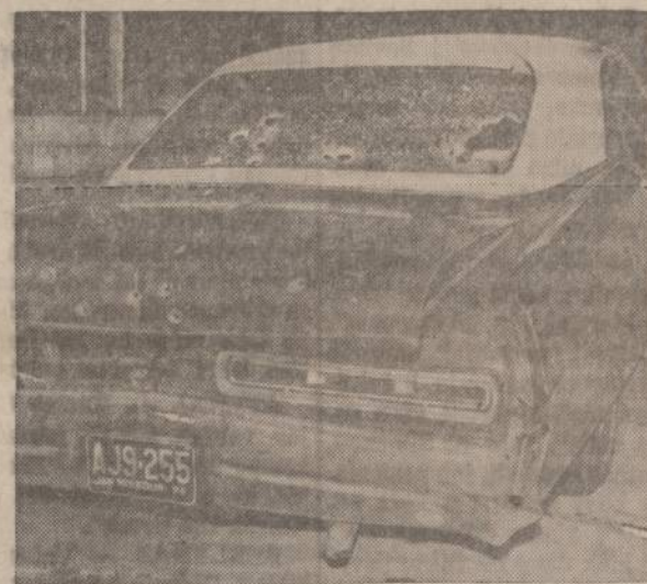
Iš Indianos pabėgė 3 kaliniai pasiekė Nebraską. Ten juos policija norėjo sustabdyti, bet jie nušovė vieną policininką. Policija apšaudė jų automobilį, kuris buvo matomas paveiksle. Visi kaliniai suimti, vienas sužeistas.

— Atsarga gėdos nedaro, ypač kai jau pusė valandos, kai tavo apsiausto kabant nebematau.