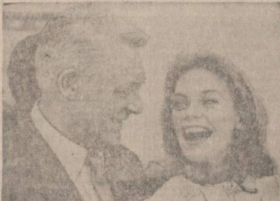
Praeitais metais 63 metų kino aktorius Cary Grant ir 30 metų jo žmona Dyan Cannon buvo labai laimingi, bet šiais metais jaunoji žmona jau prašo perskyrų.