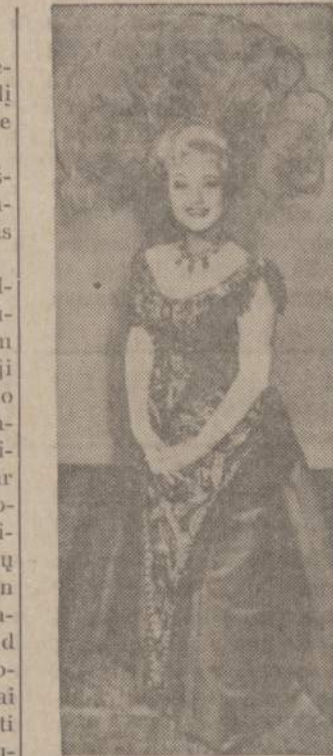
Išgarsėjusi Dorothy Lamour dabar dirba Las Vegas teatre. Jai tenka pasirodyti "Hello Dolly" komedijoje. Artistė Ginger Rogers taip pat pasirodo tame pačiame teatre.