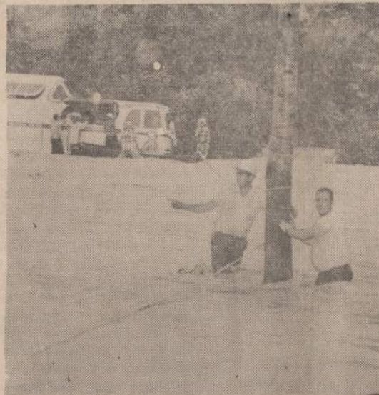
Liūlys apsmėnė visą eilę tiltų ir miestelių Georgia, Alabama ir abiejose Carolina valstijose. Paveiksle matome Hefflin, Ala., mieste lyje apsmėntą autobusą. Vietos vyras padeda iškelti keleivius sausumon.

si jų nacionalinis antagonizmas, jų pretenzijos į Kinijos buvusias teritorijas, kurias caristinė Rusija yra atplėšusi nuo Kinijos imperijos... J. Gs.