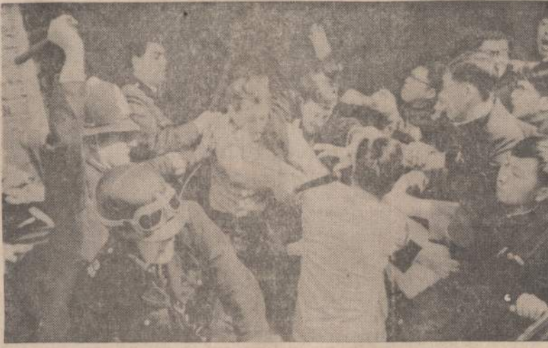
Londonė britų policija mušasi su komunistinės Kinijos ambasados atstovais. Britų policija buvo priversta vartoti gumines lazdas, kad galėtų apmrinti savo galia rodančius komunistus. Praeiti savaitę komunistai suėgino britų rūmus Pekine.

Nauji miškų gaisrai prasidėjo Idaho ir Oregone. Miškų gesinimui jau trūksta savanorių gesintojų.