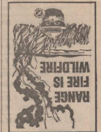
PIRKITE JAV TAUPYMO BONUS

Nežiūrint to, rugsėjo 8-ji turi savo prasmę. Ji amžių bė-gyje parodo Lietuvos troškini-mą būti laisvai ir nepriklauso-mai. Jei laisvė yra duodama tautos niekad neturėjusioms nepriklausomybės, tai tuo la-biau ji turi būti duota toms tautoms, kurios turi aukštą kultūrą ir senas valstybines tradicijas.