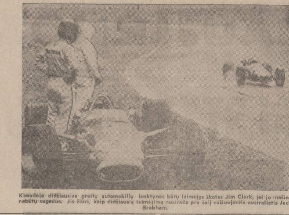
Kanadoje didžiausias greitu automobilių lenktynos būru laimėjęs skotas Jim Clark, jei jo mašina nebūtų sugedus. Jis žiūri, kaip didžiausią laimėjimą nusineša pro šalį važiuojantis australietis Jack Brabham.