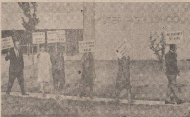
Michigan valstijos mokytojai streikuoją, mokyklose nepradėtas darbas. Paveiksle matome Inkster miestelio, esančio netoli Detroito, streikuojančių mokytojų pikietininkų grupę.

JERUZALĖ. — Prancūzų mokslininkai rado Izraelio kalnuose keturis žmogaus skeletus, kurie esą 40,000 metų senumo.