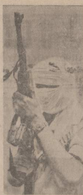
Pietų Arabų Federacijos kariai puola britus. Britai yra pasiryžę duoti arabams savivaldą, bet jie nenori perleisti valdžios mažai ginkluotai grupei.

Paskui buvo kalbėta apie liuanistinio mokymo rėmėjus ir talkintinkus. Iki šiol gyvenimo praktika parodė, kad tik Lietuvos kaimo į pramonės