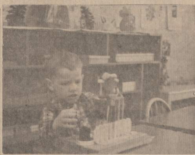
Am. Lief. Montessori d-jos Vaikų Namelių auklėtinis dirba su įvairių atspalvių vandeniu, tuo lavindamas spalvų pažinimą ir rankų taiklumą.