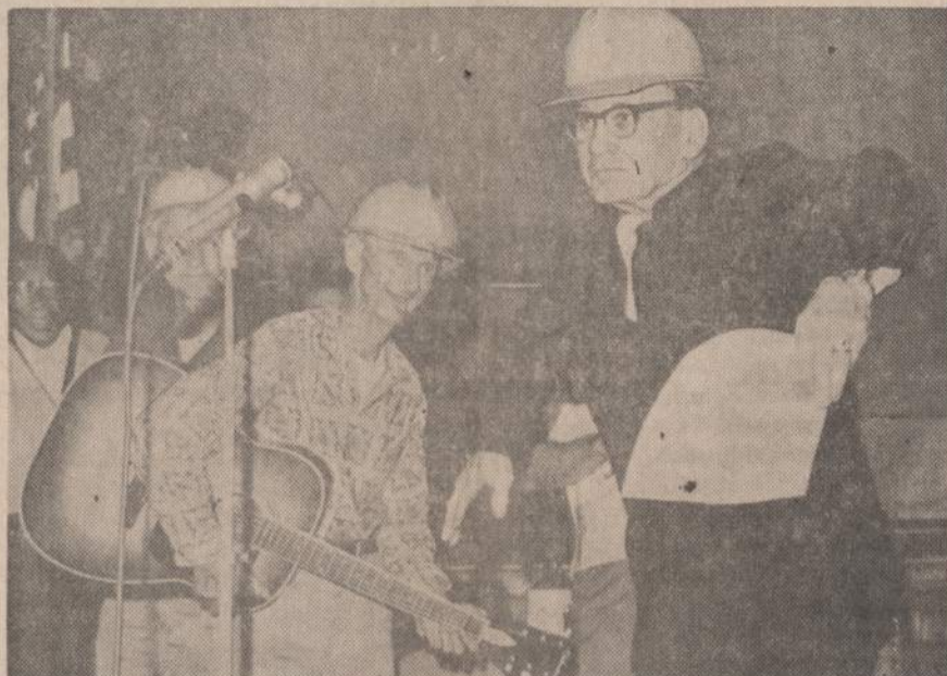
Senatorius John McLellan priėmė senų fermerių delegaciją ir parodė, kad jis moka šokti pagal seną gitaros muziką. Senato pakomitetis studijuoja, kokį darbą duoti dirbti galintiems seniems.

Kultūrinė revoliucija Kinijai labai pakenkė ir dar nesimatoma kenkimui galo.