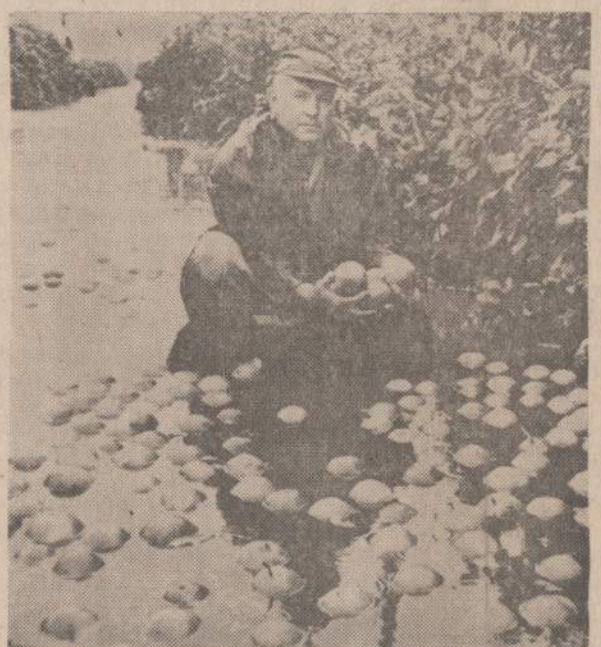
Floridos pakraščiais nusiatė uraganas Beulah. Jis padarė didelius nuostolius visiems citrinų vaisių apgintojams. Vien fiktai greiffrutų augintojų nuostoliai siekia 50 milijonų dolerių. Smarkus uraganas vėjas nukrėtė nepribrinkusius vaisius. Paveikslė matome augintoja, renkantį vandenin nukritusius vaisius.

KINSASA. — Kongo sukilėliai — baltieji samdiniai kareiviai — perėmė per savo radiją Bukavu miestą, kad jie numušė vieną Kongo lėktuvą, kuris puolė jų pozicijas. Zambija, Burundi ir Rwanda pasiūlė priimti su baltais sukilėliais kartu kovojančius katangiečius, jei jie panorės keltis į tuos kraštus.