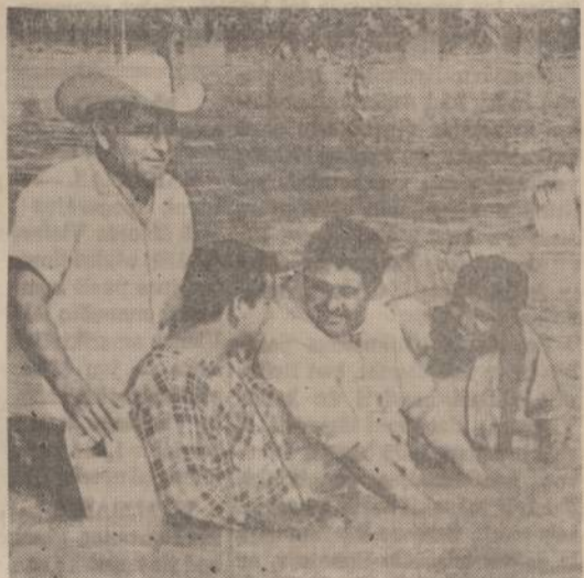
Pietinės Texas valstijos dalies gyventojai išsisiūsusė parke ant suolo. Rio Grande upės patvyniai apėmė didelius žemes plotus.

Praejuosiose Tarybos sesijose Centro Valdybos nariai, kaip nerodo įstatai, balsavimo teisę turėjo ir jos atėmimo klausimas nebuvo keliamas, nes Centro Valdyba turi eiti pareigas iki naujai išrinktas CV pirmininkas sudaro naują valdybą. Pastangos atimti balsavimo teisę CV nariams šioje sesijoje buvo keliamas ne Bendruomenės labui, bet atskirų asmenų ir grupės užmačioms atsiekti.