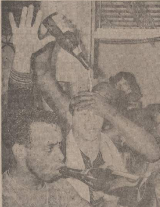
Bostono Red Sox, laimėję rungtynes, gavo šampano. Vienas žmogus nemėgstantis žaidėjas, šiuo skystimėliu galva trenka, o kitas dideliais gurkūniais troškulį ramina.

Kitas pavyzdys: Vienas žmogus su žmona atidarė krautuvę ir po to gavo širdies smūgį. Jeigu jis negautų Medicaid pagalbos, tai bankrutuotų ir turėtų perduoti krautuvę išlaidų paden-