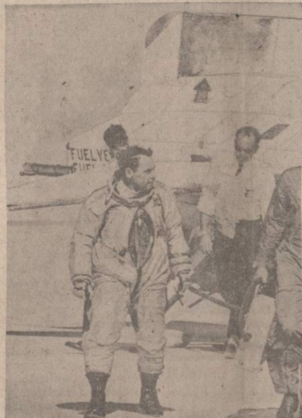
JAV aviacijos majoras William Knight bandomuoju X-15 lėktuvu skrido 4534 mylių greičiu į valandą. Trynimasis buvo toks didelis, kad užpakalinė lėktuvo dalis iškrito ir užvirė, bet lakūnui pavyko nusileisti ir laimingai išlipti iš lėktuvo.

Dėl tos priežasties miestų gyventojai bėga toliau į Egiptą. Vyriausybė bijodama, kad jie nesusigrūstų Kaire, siunčia juos į provincijas.