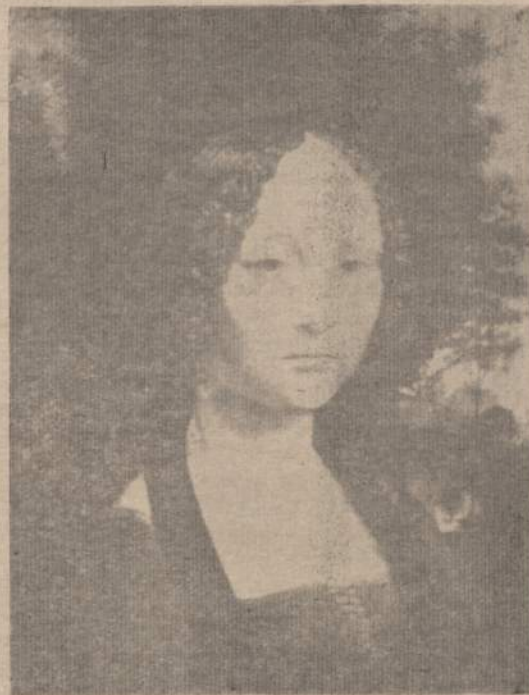
Leonardo da Vinci "Ginevra Dei Benci"

Washingtono (D. C.) Nacionalinė meno galerija neseniai nusipirko Leonardo da Vinci "Ginevra Dei Benci" (moters portretas), sumokėdama 5 milijonus dolerių. Nacionalinę meno galeriją įsteigė Andrew Mellon ir padovanojo valstybei.