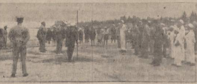
Iškilmėse prie Huron ežero buriavimo užsiėmimus pradant. Vaizdas iš buv. Jubiliejinės stovyklos.