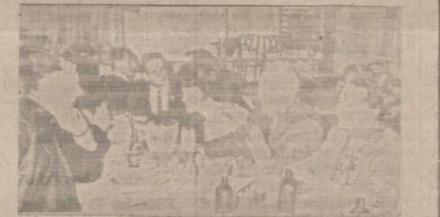
LIETUVIS SUSITINKA SU LIETUVIU

Be to, kas jį įgaliojo su atvykusiais komunistais tartis Lietuvos nepriklausomybės gairių nustatymo reikalais?