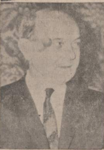
Ruskas, kalbėdamas apie karo eigą Pietų Vietname, pareiškė, kad kažkoks korespondentas sugalvojo Saigone sėdėdamas žodį "akligatvis". Tokio dailto Vietname nėra. Nei mūsų ambasadorius, nei karinė vadovybė nesutinka, kad Amerika būtų atsidūrusi akligatvyje. Viet Congo dezertyrai vis didesniais skaičiais perbėga į Pietų Vietnamo pusę. Vis mažiau komunistai užverbuoja naujų narių Viet Congui. Pietų Vietnamo dezertyrų skaičius smarkiai sumažėjo.

WASHINGTONAS. — Valstybes sekretorius Deanas Ruskas spaudos konferencijoje išsamiai paaiškino JAV užsienio politikos kelius, daugiausia sutodamas prie Vietnamo karo ir jo tikslų. Jis įspėjo, kad jei Amerika šiandien atsisakytų savo įsipareigojimų ir pažadų Pietryčių Azijai ir Pietų Vietnamui, tai Amerika pati atsidurtų mirtiname pavojuje. Apie Kinijos pavojų Azijai Ruskas pareiškė, kad greit bilijonas kinų grasins bilijonui kitų Azijos gyventojų. Jie žiūri į Ameriką ir laukia jos pagalbos.