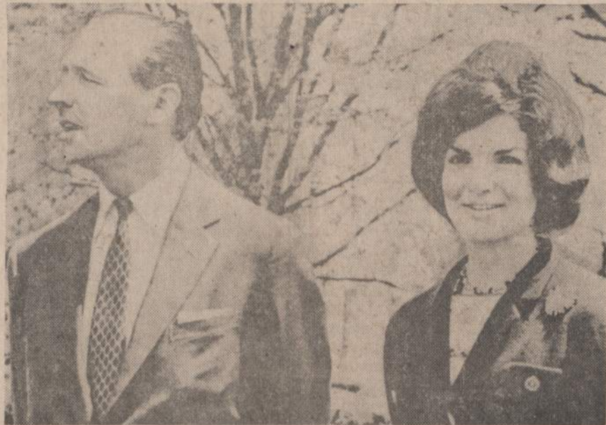
Buvęs britų ambasadorius Washingtonė David Ormsby - Gore buvo geras žuvusio prezidento Kennedy draugas. Ši fotografija traukta tais laikais Washingtonė. Dabar skleidžiami gandai, kad jis rengiasi prašyti našlės rankos, bet tie gandai kelis kartus buvo paneigti.