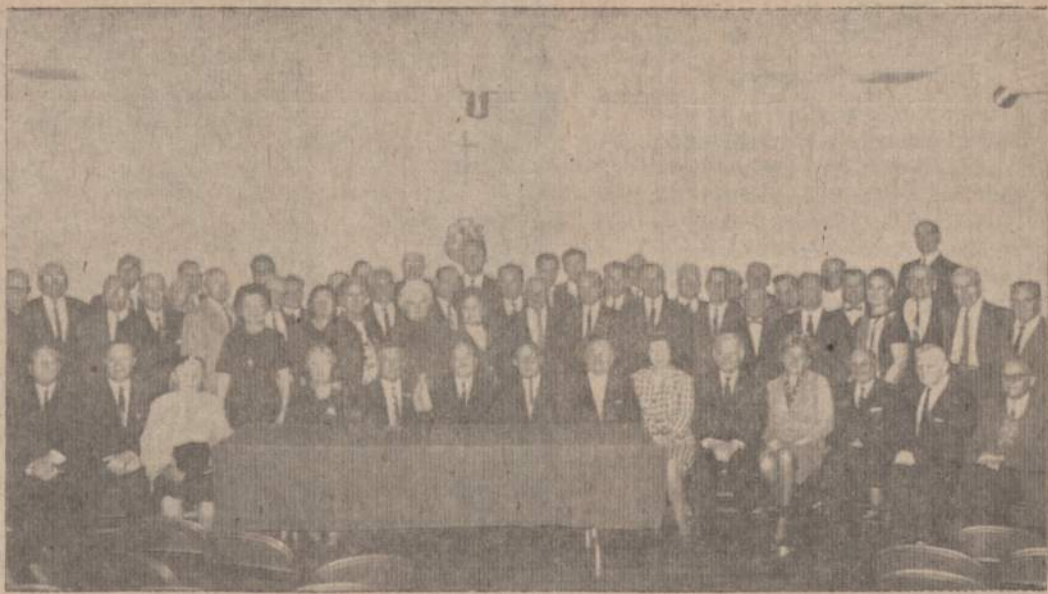
Čikagos Lietuvių Tarybos metinės konferencijos dalyviai, susirinkę Vyčių salėje spalio 8 d. Konferencijoje dalyvavo 40-ties organizacijų atstovai.