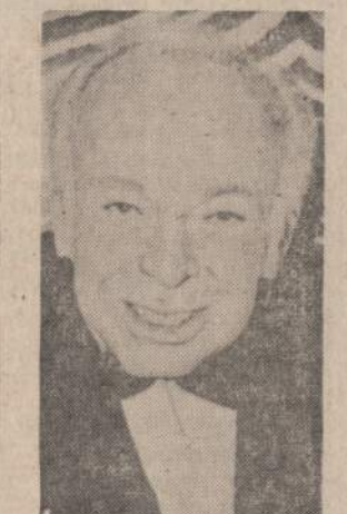
Milijonierius Tommy Manville, su laukęs 74 metų amžiaus, mirė nuo širdies priepuolio. Jis buvo vedęs 11 jaunų moterų. Skrybiu metu išmoko kėle toms pusantro milijono dolerių. Dienas baigė su 26 metų vokiečių, slaugiusia jį ligos metu.

Castro pareiškė, kad iš mūšio su Bolivijos kariuomene aprašymų, aišku, kad Guevaros grupė buvo išduota vyriausybės kariuomenei dezertyro. Jis netikis, kad Guevara prieš mirtį būtų prisipažinęs pralaimėjus. Guevara niekada priešui to nepasakytų, — pridėjo Castro.