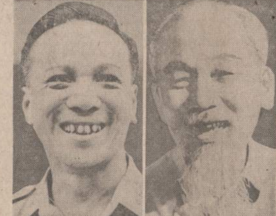
Saigono prezidentas Thieu (kairė) rengiasi pakviesti komunistą Ho Chi Minh į Saigoną, kad prasidėtų pasitarimai Vietnamo piliečiams karui baigti. Nežinia, ar Hanojaus valdžia norės tartis.

Šis svarbios politinės partijos sprendimas atmeta tuo pačiu ir Prancūzijos prezidento de Gaulle prieš kelis mėnesius mestą Montrealyje šūkį "vive le Quebec libre — tegyvuoja laisvas Quebecas"!