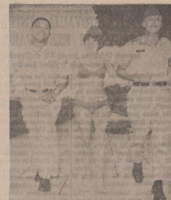
Vietname kovojusieji Amerikos kariai atostogas leidžia Australijoje. Sidneju atvykusius du karius pasitiko jauna australietė.