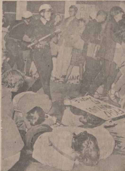
Grupė pacifistų Oaklando, Cal., miestelyje sukrito ant žemės, kad naujokai negalėtų įžengti į naujokams šaukti centre. Policija išakė sugulsiems keltis ir neardyti tvarkos. Jie buvo prikelti ir nuvežti į policijos nuovada. Jiems teks aiškintis teisme už tvarkos ardymą.