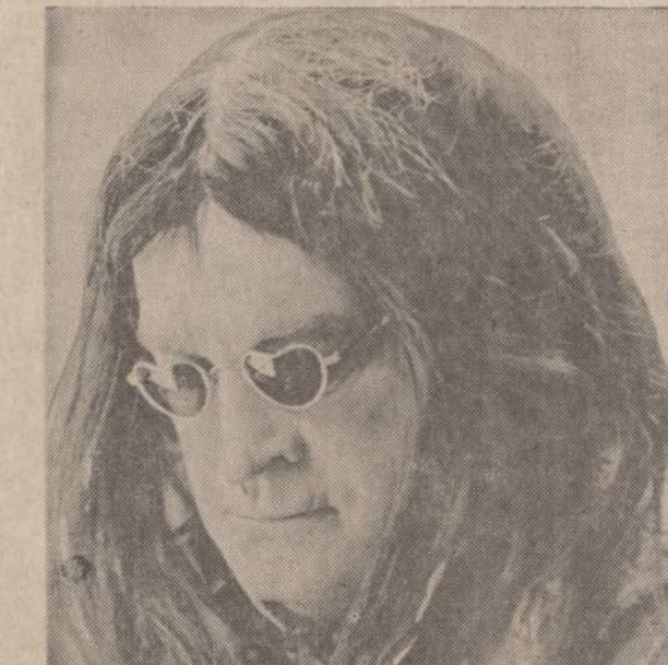
Kino ir televizijos artistas Bob Hope, vienas seniausių "gėlės kū- dikių", užsėdėjo ilgų plaukų paruka, kad galėtų patraukti per dantį Kalifornijoje praplitusius hipus.