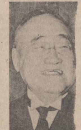
Buvęs Japonijos premjeras Josida, sulaukęs 89 metų amžiaus, spalio 20 diena mirė savo namuose. Japonijoje jis padėjo pagrindus demokratinei santvarkai.