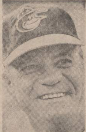
Hank Bauer ateinančiais metais bus Baltimorės Orioles manadžeris. Šiais metais Orioles iš pirmos vietos pateko į antrąją, bet nutarė vis dėlto manadžerį palikti tą patį.

Chicago Tribune ir jų išplatinta jau arti 10,000. Norintieji prisidėti prie skautų žygio, stikerių po 8 centus už 25 gali gauti Tribune name prie Michigan Ave. arba jos ofise 33 W. Madison St. miesto centre.