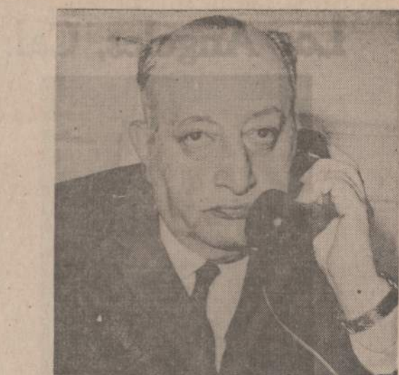
Guatemalos poetas Miguel A. Asturias gavo Nobelio premiją už naujai sukurtus poezijos kūrinius. Poetas Asturias yra Guatemalos ambasadorius Paryžiuje.

Kaip anksčiau pastebėjau, airodu, kad šios šalpos rinkimo organizacijoje esantys kai kurie asmenys vis dar laikosi biblijinį laikų dvasios ir peršamums pavyzdžiu kilių pašaukimų bei gražiai skambančių profesijų titulų, bet ne patį pagrindinį šio darbo talkininką! Ar kartais neleiks pasieškoti